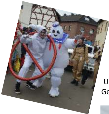
Und Geister hatten an diesem Tag keine Chance, denn die Geisterjäger waren los. Die Ghostbusters aus Stotzheim.