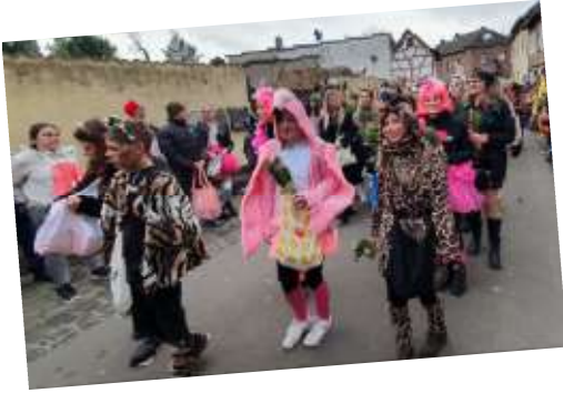
Tanzgruppe aus Billig