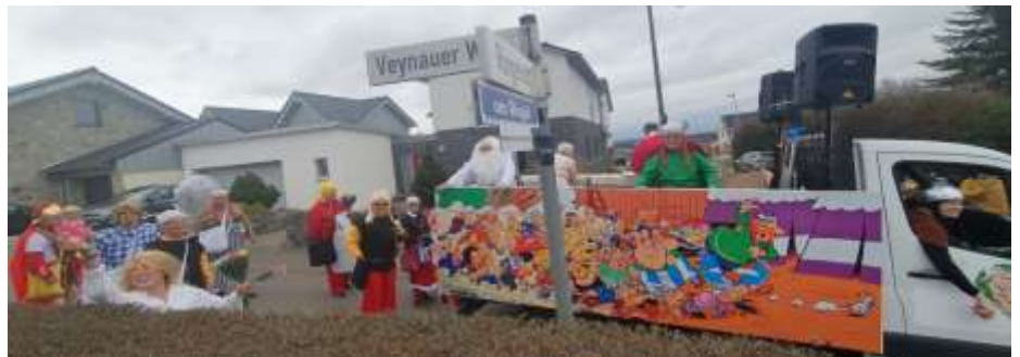
Die Gallier sind los, Ähnlichkeiten von Personen sind rein zufällig.